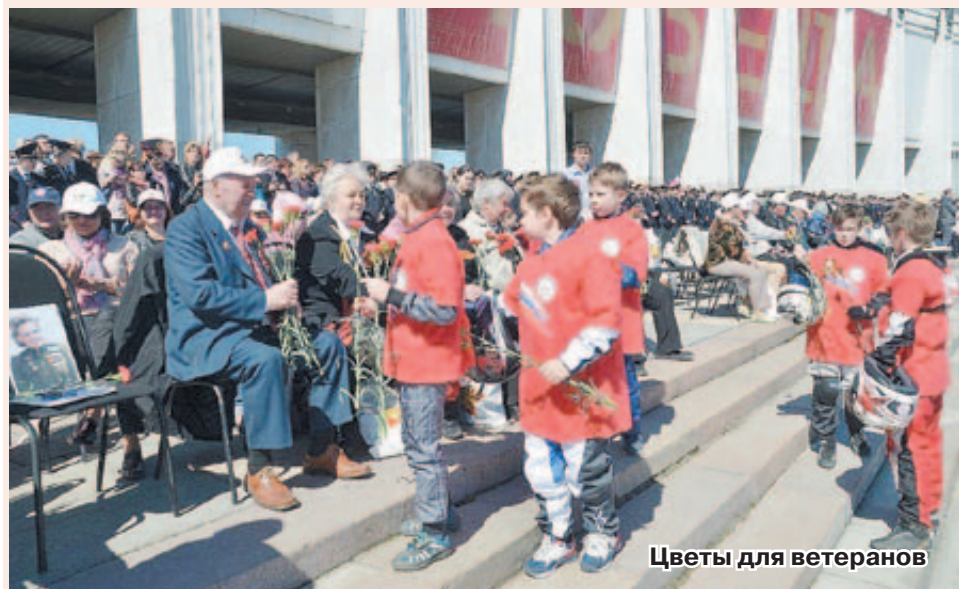
Цветы для ветеранов

Экспозиция подготовлена участниками программы «Школьный музей Победы» — активистами музея Московского колледжа управления, гостиничного бизнеса и информационных технологий «Царицыно». В выставку вошло более 70 экспонатов: документы, фотографии и личные вещи участников Первой, Гражданской и Второй мировой войн из семейных династий сотрудников и учащихся колледжа. В основу музея была