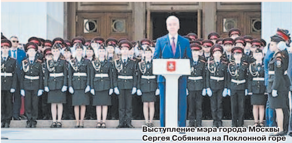
Выступление мэра города Москвы Сергея Собянина на Поклонной горе