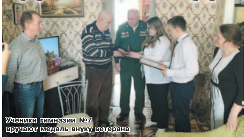
Ученики гимназии №7 вручают медаль внуку ветерана

области, может быть какие-либо его родственники? Медаль по праву должна находиться в семье героя! Хотелось знать, за что была ему назначена эта награда, проследить судьбу ветерана в послевоенные годы.