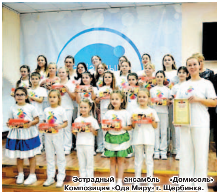
Эстрадный ансамбль «Домисоль» Композиция «Ода Миру» г. Щербинка.