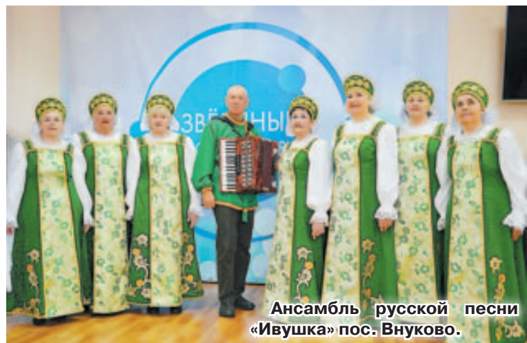
Ансамбль русской песни «Ивушка» пос. Внуково.