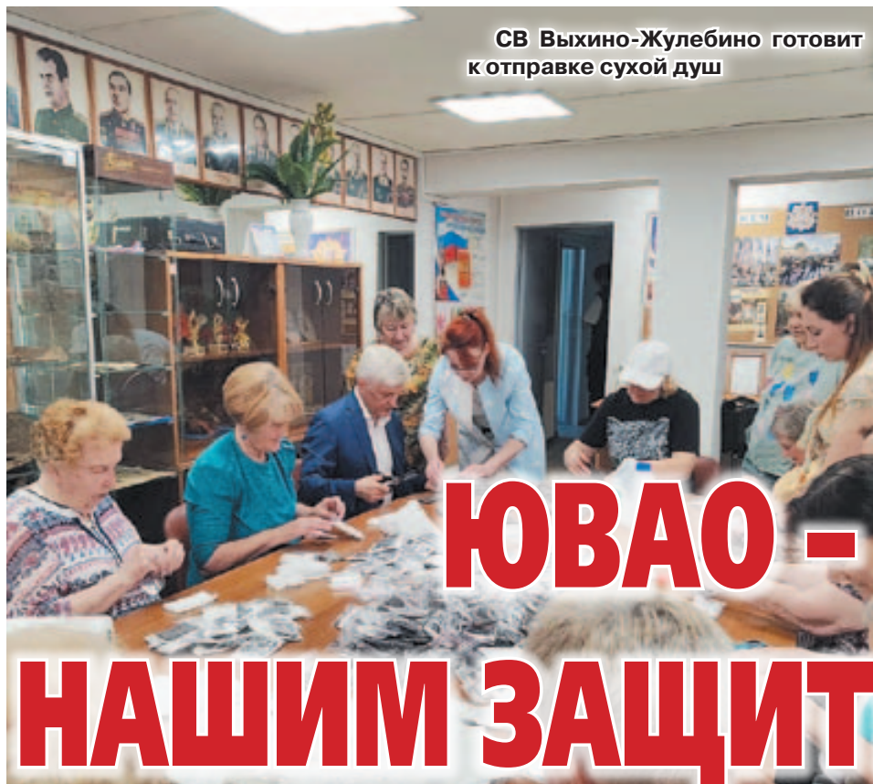
СВ Выхино-Жулебино готовит к отправке сухой душ

Мужество наших ребят начиная с первого дня Специальной военной операции не оставило равнодушными ветеранов ЮВАО. Помощь бойцам началась практически с первых месяцев. Когда стала поступать информация с фронта о недостатке теплых вещей, нижнего и постельного белья, воды, продуктов питания, носилок, медикаментов и других средств защиты и ухода, ветеранский актив организовал сбор необходимого среди членов своих организаций.