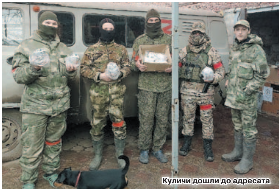
Куличи дошли до адресата