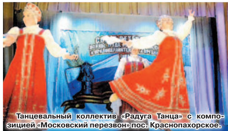
Танцевальный коллектив «Радуга Танца» с композицией «Московский перезвон» пос. Краснопахорское.