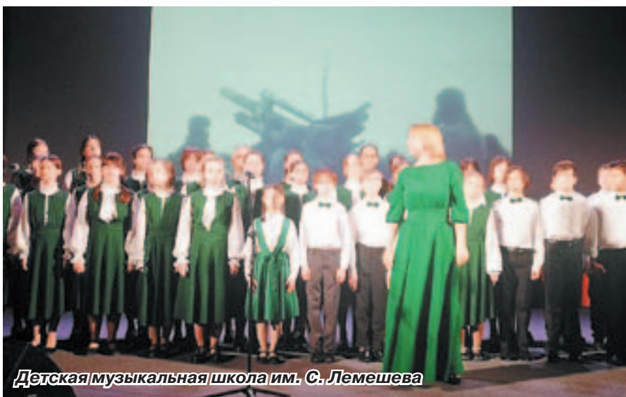
Детская музыкальная школа им. С. Лемешева