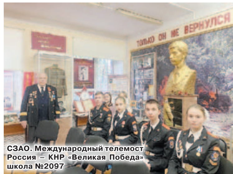
СЗАО. Международный телемост Россия – КНР «Великая Победа» школа №2097

школы вошёл в топ-200 школьных музеев Победы.