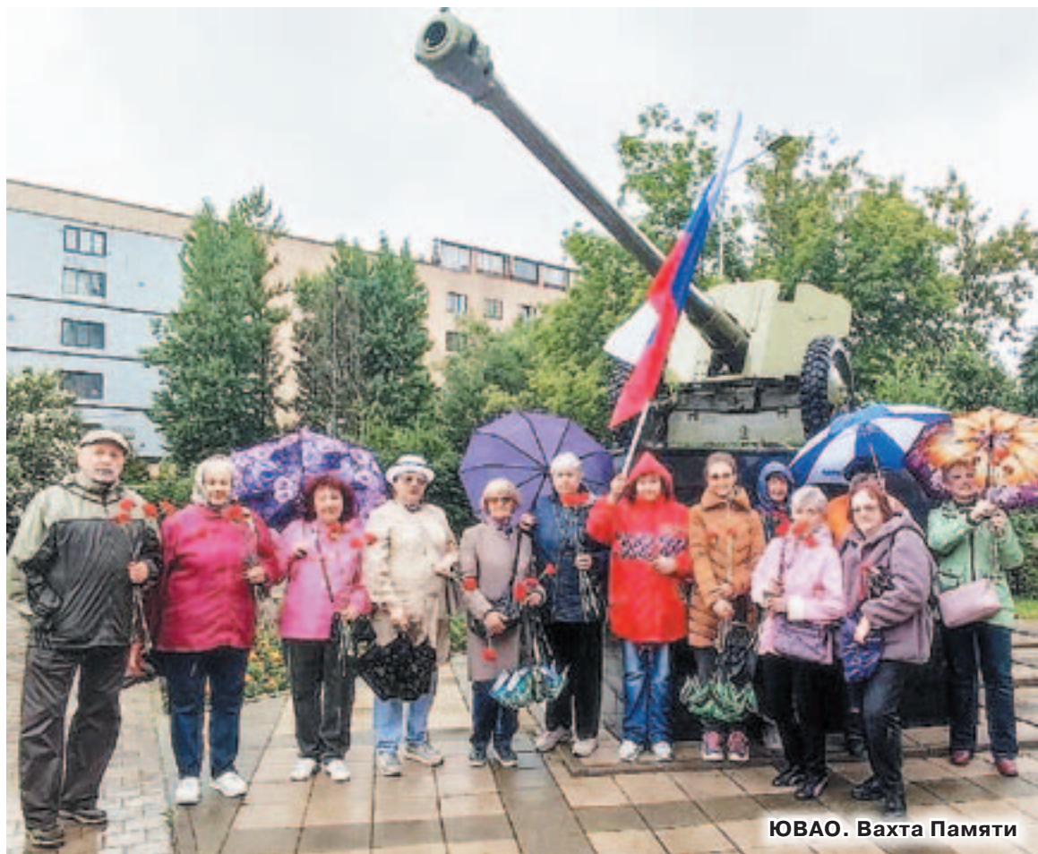
ЮВАО. Вахта Памяти