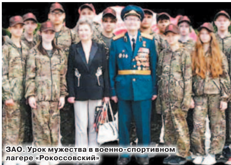
ЗАО. Урок мужества в военно-спортивном лагере «Рокоссовский»