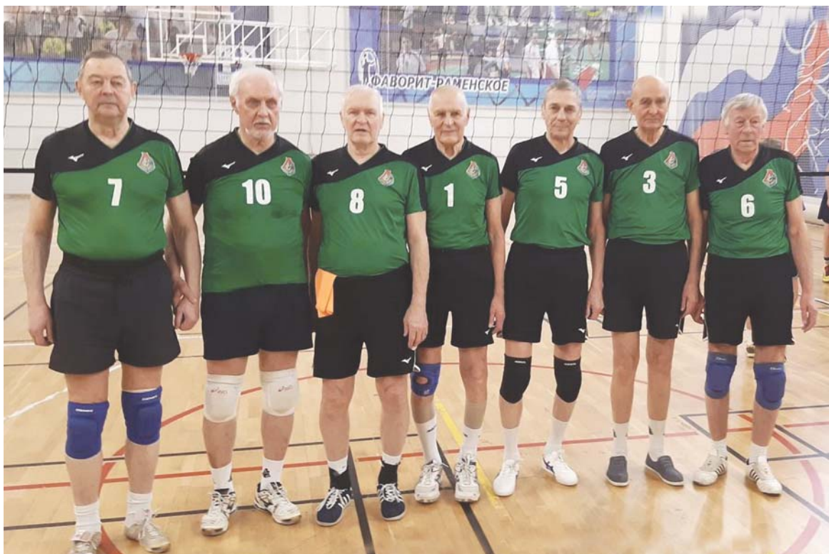
На фото: ветеранская волейбольная команда ОАО «РЖД», ставшая в 2020 году Золотым призером на Чемпионате в Анапе.

Кстати, экземпляры выпусков, где говорится о Чемпионате и волейбольной команде ветеранов - железнодорожников, будут вручены мной игрокам во время их возвращения в Москву. Спасибо, любимая газета!