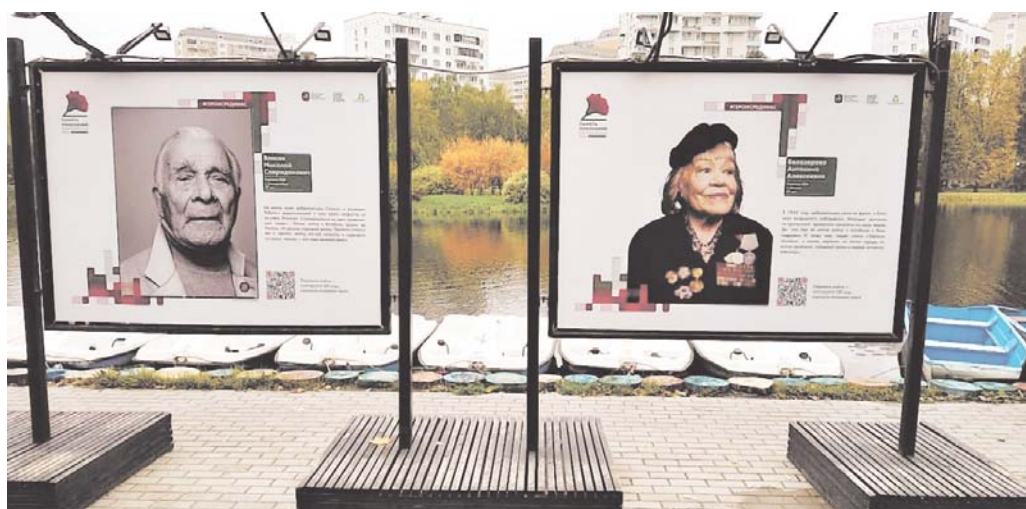
ФОТО-ПРОЕКТ «ГЕРОИ РОССИИ»

С начала октября в Дмитровской районе в парке «Ангарские пруды» можно увидеть 28 работ фотографов Даниила Головкина, Славы Филиппова и Ольги Тупоноговой-Волковой, широко известных в России и за рубежом. Герои выставки - ветераны Великой Отечественной войны.